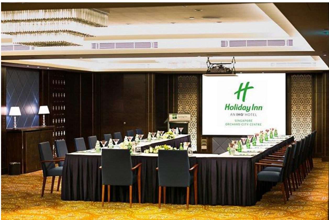
Notre Salle de cours Adaptée pour une formation de qualité